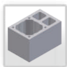
bloks ar 2 ventilācijām