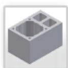
bloks ar 2 ventilācijām