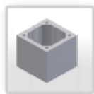
viena kanāla bloks