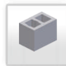
Skursteņa bloks Ø 120 (36x36)