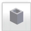
Skursteņa bloks Ø 80 (24x68)