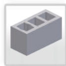
Skursteņa bloks Ø 120 (36x50)