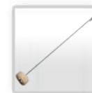
Instrumenti liekās javas noņemšanai