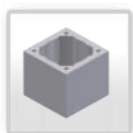
Skursteņa bloks Ø 80 (24x20)